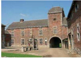
Difficulté : faible Départ : Burdinne, parking de la Ferme de la Grosse Tour 1

Nous commençons la promenade par l'observation de cette imposante ferme en quadrilatère fermé. Elle présente un porche colombier donnant accès à la cour intérieure. Au milieu de celle-ci, un puits du 18 e siècle avec une rose des vents en fer forgé vient d'être restauré. La forme en quadrilatère fermé était utilisée jadis pour des raisons de défense contre les pillards ou les armées en campagne. La plupart des orifices extérieurs sont d'ailleurs situés à bonne hauteur et souvent garnis de barreaux. Les bureaux de la Maison du Parc Naturel des Vallées de la Burdinale et de la Mehaigne et ceux de la Maison du Tourisme y sont installés.